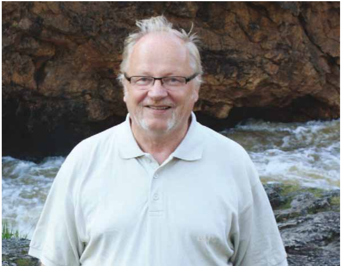
Kirjoittaja toimi Järvenpään sosiaalisairaalan ylilääkärinä vuosina 1997-2010 ja on VEU:n hallituksen jäsen.

Näin on tapahtunut Pohjois-Afrikassa, missä hallituksia on kaatunut ja Etelä-Euroopassa missä ihmisten vilpityn pyrkimys on ollut kansalaisosallistuminen ja demokratian laajentaminen. Kuluneen kesän purkaukset Norjassa ja Britanniassa ovat olleet joko äärioikeistolaisia terroritekoja tai jäsentymätöntä pahan olon purkamista lähiympäristöön. Suomen koulusurmissakin on ilmennyt jäsentymätöntä ihmisvihaa, joka on ollut sukua vastaaviin ilmiöihin USA:ssa ja Keski-Euroopassa sekä kaukaista sukua yksilöpsykolo-