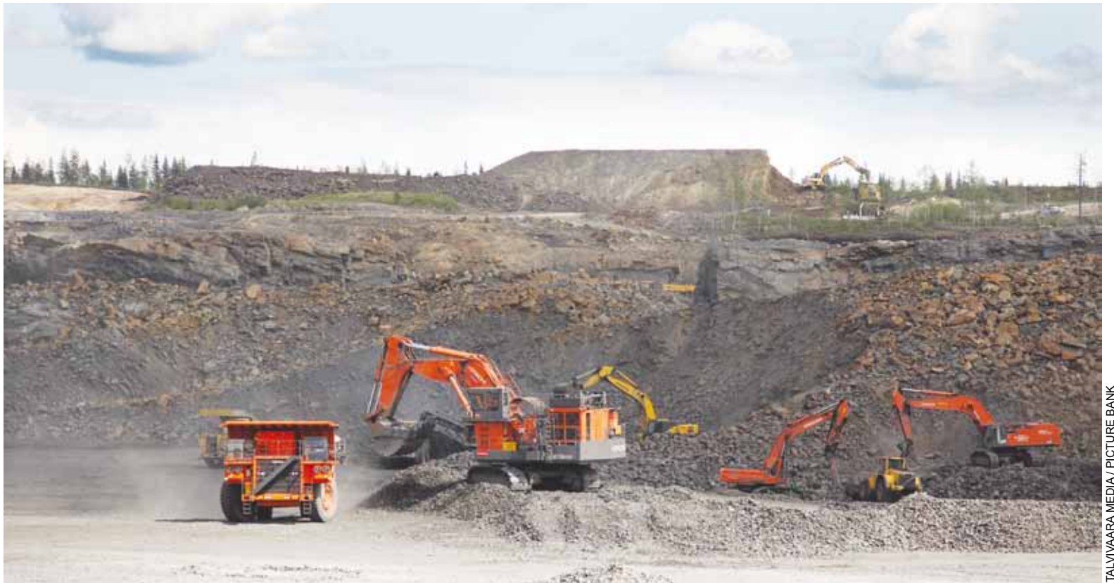
Nikkeli –vai uraanikaivos? Talvivaara haluaa molemmat, mutta ilman uutta ympäristölupaa.

Lissabonin perussopimukseen liittyvän Euratom-sopimuksen kautta olemme velvoitettuja ilmoittamaan asiasta EU:lle. Tämän joh-