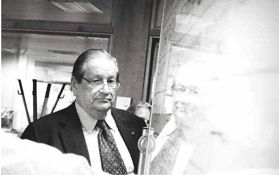
Aatos Erkko 1932-2012