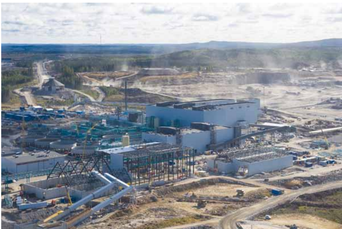
Talvivaaran ympäristöhaitat vaikuttavat paljon tehdasaluetta kauemmaksi