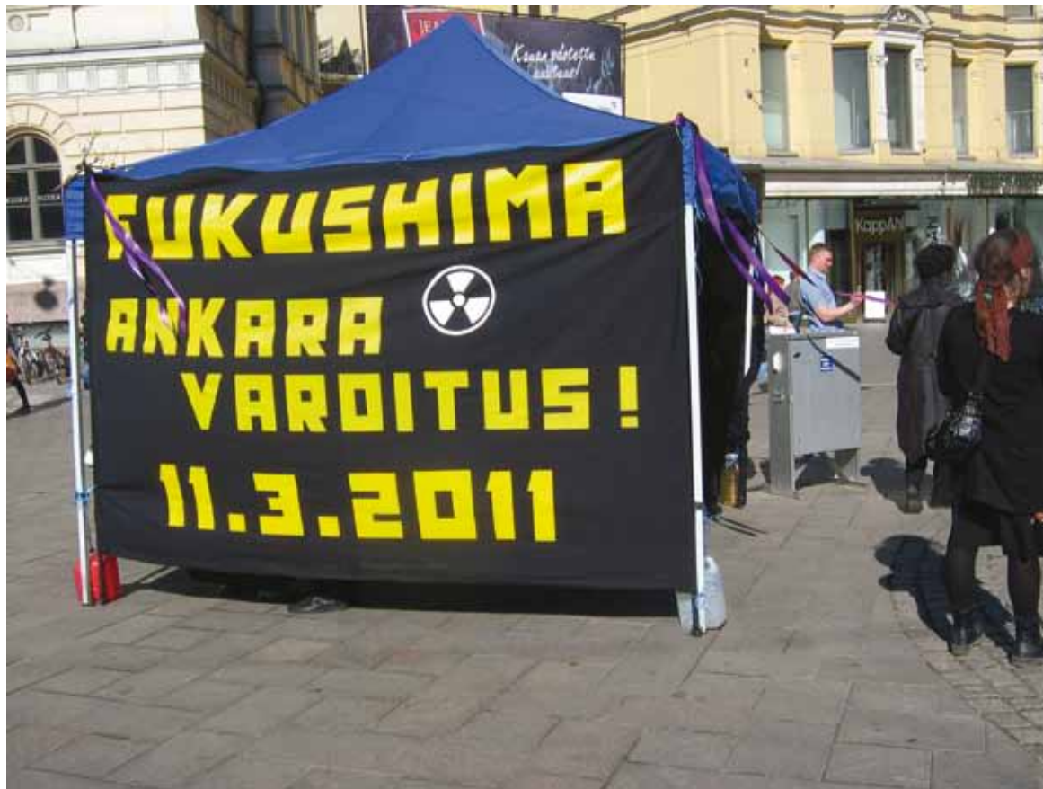
Helsingissä marssittiin ydinvoimaa vastaan 26.4.2011

Euroopan unionin 27:stä jäsenmaasta ainoastaan