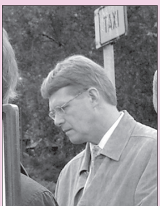
Matti Vanhanen vastustaa kansanäänestystä.