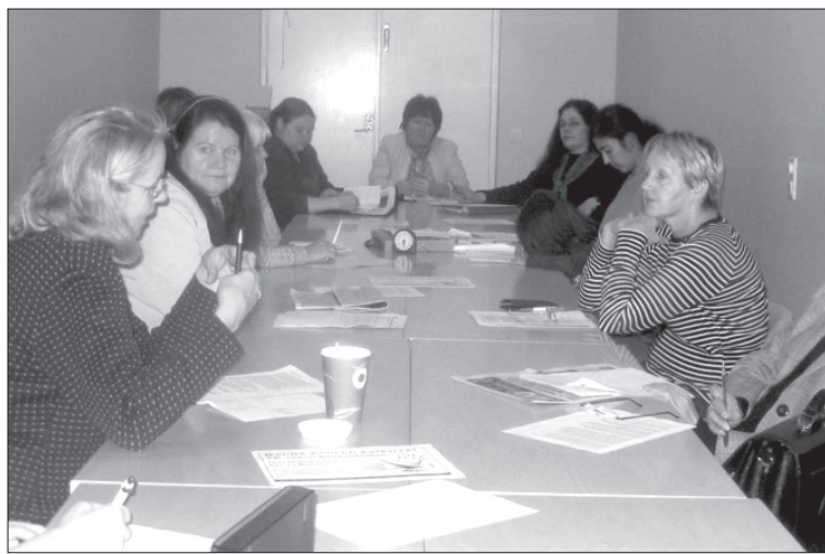
Naisten tapaamisessa EU:n perustuslakiesityksestä vaadittiin kansanäänestystä.

Tosin kuultiin myös toisenlaisia esimerkkejä siitä, että yhden vaih-