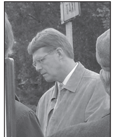
Pääministeri Matti Vanhanen torjui kansanäänestyksen käydessään kansan parissa Tampereella.

Aikaa on runsaasti. Kansalaisten painostus voi vielä muuttaa poliittisen eliitin suunnitelmat. Kansanäänestyskampanja Suomessa jatkuu ruohonjuuritason tasolla. Kansanäänestysvaatimuksen voi allekirjoittaa nimenkeräyslistoihin sekä VEU:n kotisivulla että kansanäänestysliikkeen kotisivulla: www.kansanaanestys.fi