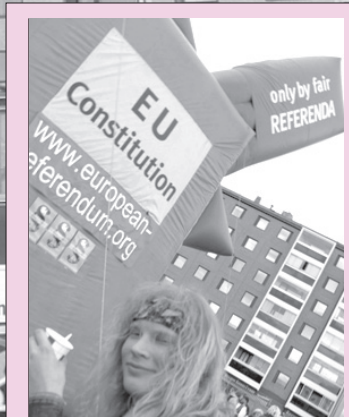
Janne Järvinen vaatii kansanäänestystä.

Kansanäänestysliike järjesti bussikiertueen suurimmissa kaupungeissa saksalaisen Mehr Demokratie-liikkeen kanssa. Kuva Tampereen Tammelantorilta, jossa reilut kaksisataa kansalaista allekirjoitti vetoomuksen kansanäänestyksen järjestämiseksi EU:n perustuslaista. Järvisen ajatuksista ja bussikiertueesta sivulla 4.