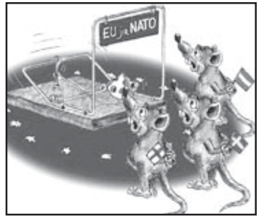
EU on vain alkupala