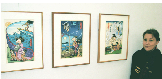
Tuula Moilanen (myös esitteen kuvitus)