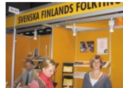
Folktingets stånd under Helsingfors Bokmessa.