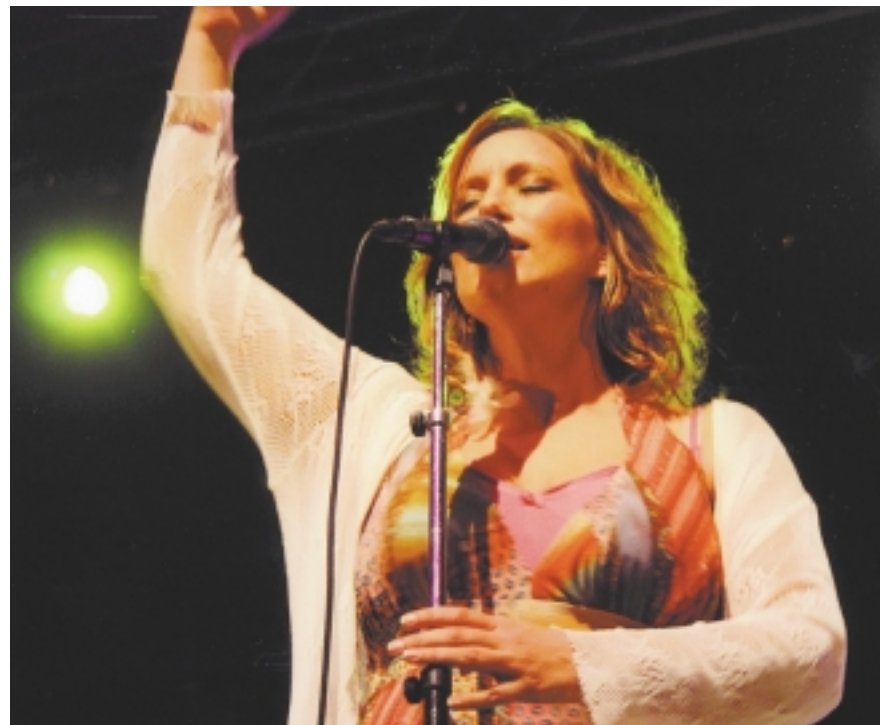
Lisa Nilsson sjunger på huvudfesten i Åbo.