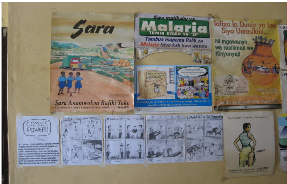
Työpajassa tehtyjä sarjakuvia levitettiin mwanzalaiseen terveystakeskuksen odotustilaan.

Sarjakuvatyöpaja oli kaiken kaikkiaan hyvä kokemus. Osallistujat tunsivat piirustus- ja tarinankerrontataidon avaavan heille uusia ovia elämässä. Sarjakuvaa aiotaankin käyttää tulevaisuudessa CHAVITA:n kampanjoinnissa. Työpajan osallistujat uskoivat, että heidän sarjakuvansa auttavat ympäröivää yhteisöä ymmärtämään kuurojen kohtaamia ongelmia ja haasteita. He toivoivat, että sarjakuvat myös rohkaisisivat ihmisiä opettelemaan viittomakieltä. Ruohonjuurisarjakuva ei vaadi suuria resursseja, kynät, paperi ja kopiokone riittävät. Kuuroja voisi innostaa sarjakuvan tekoon Suomessakin!