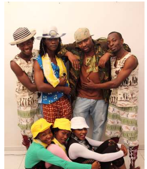
Sanaa Sana are performing on Friday at Korjaamo and Sunday at Malmintalo

On Father's day 8th of November there is even more Tanzanian music and activities with the Tanzania -event for children at Malmintalo. The kids get to make recordings with Mambo Jambo and Dudu Baya in their freestyle hip-hop workshop, and Sanaa Sana will be performing for kids and adults. The STS is present of course, so don't miss our stand! For more info about the whole Etnisoi-festival, read the program at the end of this Taarifa or check out the web page: www.globalmusic.fi/etnosoi .