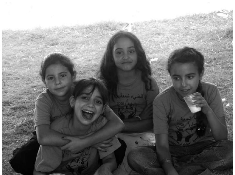
Diabetesleirin lapsia mehtuukiolla.

UM:n rahoituksen saadakseen AKYSin on kerättävä omarahoiutusosuus, 15 % koko summasta, josta osa voi olla omana työnä. Tätä varten diabeteskeräys jatkuu. Diabeetikolapsitilin numero on 800013-990505,